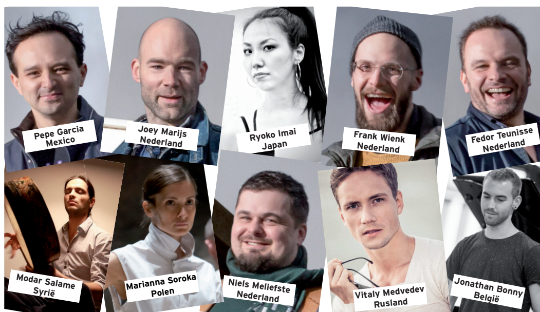
Een greep uit de SDH slagwerkers-pool inclusief de vijf SDH kernspelers.